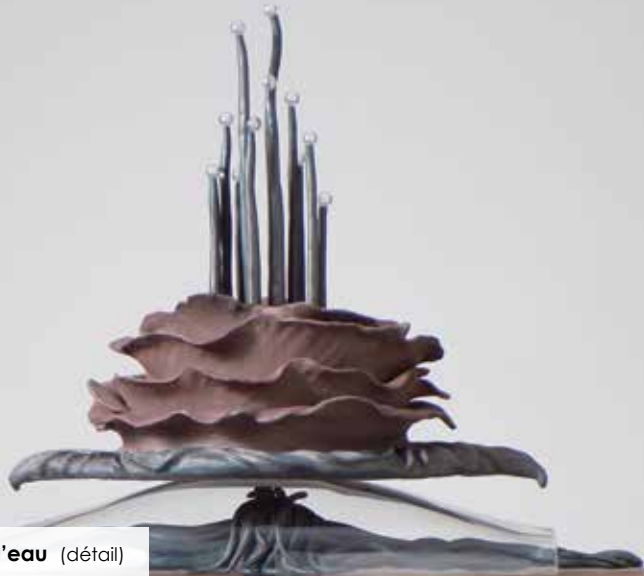
Fleur d'eau (détail)