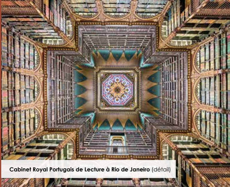
Cabinet Royal Portugais de Lecture à Rio de Janeiro (détail)